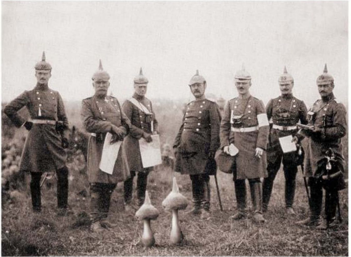
Das Bekannte im Fremden: Hier eine Delegation preussischer Kundschafter um den Forschungsreisenden und Hauptmann Hermann Wissmann (1853-1905) bei der Inspektion und Aufnahme einer entdeckten Biomorph-Art im späteren "Deutsch-Ostafrika".